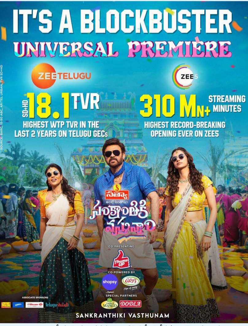
చేయాల్సిన అవసరం ఉందని సినీ విశ్లేషకులు చెబుతున్నారు. అలాంటివి లేకపోతే, ఈ సినిమా డిజాస్టర్ అయ్యే అవకాశం ఉందని నెటిజన్ల అభిప్రాయం వ్యక్తం చేస్తున్నారు.

తెలుగు బ్లాక్ బస్టర్ 'సంక్రాంతికి వస్తున్నాం' ఇప్పుడు బాలీవుడ్లో రీమేక్ కానుందంటూ నెట్టింట్ పలు వార్తలు హల్చల్ చేస్తున్నాయి. విక్టరీ వెంకటేశ్, బిశ్వరాజ్ రాజేష్, మినాక్షి చౌదరి ప్రధాన పాత్రల్లో అనీల్ రావిపూడి తెరకెక్కించిన సంక్రాంతికి వస్తున్నాం చిత్రం గత సంక్రాంతి 2025 సందర్భంగా విడుదలై భారీ విజయాన్ని అందుకుంది. దిల్ రాజు నిర్మించిన ఈ సినిమా రూ. 300 కోట్లకు పైగా గ్రాస్ కలెక్షన్లతో ఇండస్ట్రీ హిట్ గా నిలిచింది. ఈ క్రమంలో చిత్రాన్ని బాలీవుడ్లో రీమేక్ చేసేందుకు ప్లాన్ చేస్తున్నారని దిల్ రాజు. బాలీవుడ్ రీమేక్ స్టార్ అక్షయ్ కుమార్తో సంప్రదింపులు కూడా చేస్తున్నట్లు టాక్ నడుస్తుంది. అక్షయ్ కుమార్ ఇప్పటికే 'భూల్ భులయ్యూ 2', 'రాడీ రాతోర్', 'లక్ష్మీ' వంటి దక్షిణాది రీమేక్లతో హిట్ ట్రాక్లో ఉన్నారు. అయితే ఇటీవల వరుస ఎ+-లావులతో అక్షయ్ కుమార్ కెరీర్ ఒడిదుడుకుల్లో సాగుతోంది. ఈ సమయంలో ఆయన మళ్లీ సౌత్ ఇండస్ట్రీ సూపర్ హిట్ చిత్రం 'సంక్రాంతికి వస్తున్నాం' లాంటి కథను ఎంచుకుంటే సేఫ్ జోన్లో పడతాడని విశ్లేషకులు కూడా అంటున్నారు. బాలీవుడ్ ట్రేడ్ వర్గాల ప్రకారం, దిల్ రాజు ప్రస్తుతం ఈ సినిమాను హిందీలో నిర్మించేందుకు బాలీవుడ్ మేకర్స్ చర్చలు జరుపుతున్నట్లు సమాచారం. వెంకటేశ్ చేసిన పాత్రకు అక్షయ్ కుమార్ సరైన ఎంపిక అని చాలా మంది భావిస్తున్నారు. తెలుగులో ఈ సినిమా విజయానికి కథ కంటే కూడా వెంకటేశ్ టైమింగ్, కామెడీ టచ్, అనీల్ రావిపూడి మేకింగ్ ప్రధాన కారణాలుగా నిలిచాయి. అయితే బాలీవుడ్ ప్రేక్షకుల అభిరుచికి అనుగుణంగా కథ, స్ట్రీమ్ ఫీల్డ్ మార్పులు