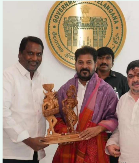
ఆదేశించారు. పూర్తి డేటాతో సంక్షేమ హాస్పల్ల

వ్యవస్థలో జవాబుదారీతనం కనిపించాలని స్పష్టం చేశారు. విద్యార్థులకు అందించే భోజనం నాణ్యతను సాంకేతిక పరిజ్ఞానంతో తనిఖీ చేయాలన్నారు. విద్యార్థులకు సరైన పోషకాలతో కూడిన పౌష్టికాహారం అందేలా చర్యలు తీసుకోవాలన్నారు. ప్రతి హాస్పల్ లో మౌలిక సదుపాయాలపై పూర్తి స్థాయి డేటాను సాంకేతిక పరిజ్ఞానంతో ఎప్పటికప్పుడు ఆన్ లైన్ లో అప్ డేట్ చేయాలని అధికారులను సీఎం రేవంత్ రెడ్డి ఆదేశించారు. విద్యార్థుల ఆరోగ్య పరిస్థితిని సమీక్షించేందుకు ప్రత్యేక విధానం అనుసరించాలని, హాస్పల్లను సమీక్షించే వైద్య కళాశాలలు, కమ్యూనిటీ హెల్త్ సెంటర్లకు అనుసంధానం చేయాలని సీఎం సూచించారు. అధికారులు తరచూ హాస్పల్లను సందర్శించి ఆరోగ్య తనిఖీలు చేయాలని దిశానిర్దేశం చేశారు.