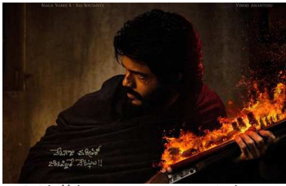
యాక్షన్ ఫిల్మ్తో ఓటీటీ ప్రేక్షకుల ముందుకు రానున్నారు. ఆయన ప్రధాన పాత్రలో రానున్న చిత్రం 'తక్షకుడు'. నెట్ ఫ్లిక్స్ వేదికగా విడుదల కానుంది. వినోద్ దర్శకత్వంలో ఇది రూపొందుతోంది 'వేటగాడి చరిత్రలో జింక పిల్లలే నేరస్థులు..' అంటూ ఓ పోస్టర్ను పంచుకున్నారు. త్వరలోనే దీనికి సంబంధించిన పూర్తి వివరాలు వెల్లడించనున్నారు.