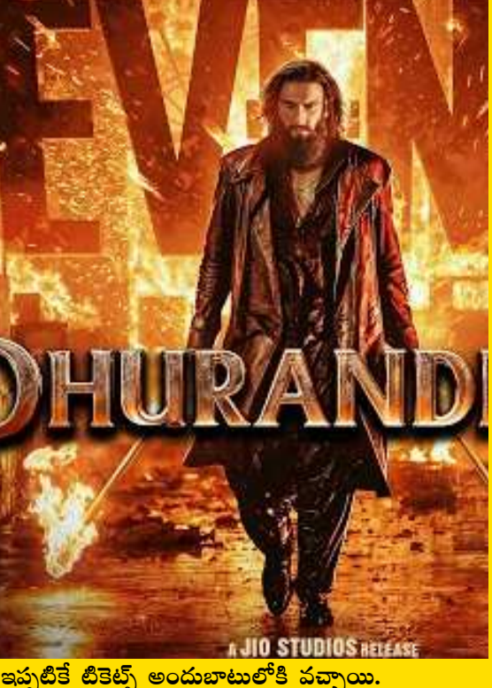
ఇప్పటికే టికెట్స్ అందుబాటులోకి వచ్చాయి.

19న ప్రపంచవ్యాప్తంగా విడుదలకు సిద్ధమయి టీకెఎల్ ధర్మల పెంచకుండానే బుకింగ్స్ ఆదిత్య ధర్ దర్శకత్వంలో రణవీర్ సింగ్ హీరోగా వచ్చిన చిత్రం 'దురంధర్' గతేడాది చివర్లో విడుదలై సూపర్ హిట్ ను సొంతం చేసుకుంది. దీనికి సీక్వెల్ గా 'దురంధర్:ది రివెంజ్' రానుంది. ఈ చిత్రం మార్చి 19న ప్రపంచవ్యాప్తంగా విడుదల కానుంది. మొదటి భాగం హిందీలో మాత్రమే విడుదల కాగా.. రెండో పార్ట్ హిందీతో పాటు తెలుగు, తమిళ, కన్నడ, మలయాళ భాషల్లో రిలీజ్ అవుతుంది. ఈ నేపథ్యంలో తాజాగా డీని ట్రైలర్ ను విడుదల చేశారు ఈ సారి పాకిస్థాన్ భవిష్యత్ ను నిర్ణయించేది భారత్ అంటున్నారని రణవీర్ సింగ్. ఆయన కథానాయకుడిగా ఆదిత్యధర్ దర్శకత్వంలో రూపొందుతున్న యాక్షన్ డ్రైలర్ 'దురంధర్:ది రివెంజ్'. సారా అర్జున్ కథానాయిక. మాధవన్, సంజయ్ దత్, అర్జున్ రాంపాల్ కీలక పాత్రలు పోషించారు. ఈ సందర్భంగా శనివారం విడుదల చేసిన ట్రైలర్ సినిమాపై అంచనాలను పెంచింది. 'దురంధర్: పార్ట్ 1'తో పోలిస్తే రెండో భాగంలో యాక్షన్ తో పాటు ఎమోషనల్ డ్రామాకు పెద్ద పీట వేసినట్లు తెలుస్తోంది. మరోవైపు 'దురంధర్'కు వచ్చిన క్రేజ్ ను ఒడిసిపట్టుకునేందుకు చిత్ర బృందం సమాధి పుట్టేసింది. ఇందులో భాగంగా ఒకరోజు ముందుగానే పెయిడ్ ప్రీమియర్స్ ద్వారా ప్రేక్షకుల ముందుకు తీసుకువచ్చేందుకు సిద్ధమైంది. అంటే మార్చి 18వ తేదీ సాయంత్రం షర్ట్ షో నుంచే 'దురంధర్:ది రివెంజ్' మూవీని ప్రదర్శించబోతోంది. ఇప్పటికే బుకింగ్స్ పో, డిస్ట్రిక్ యాప్ల ద్వారా టికెట్ బుకింగ్స్ ను అందుబాటులోకి తెచ్చింది. హిందీతో పాటు, ఇతర దక్షిణాది భాషల్లో ఈ సినిమాను తీసుకొస్తున్నా.. పెయిడ్ ప్రీమియర్స్ వరకు హిందీలోనే బుకింగ్స్ ఓపెన్ అయ్యాయి. హైదరాబాద్ లోని వివిధ మల్టీప్లెక్స్ లో