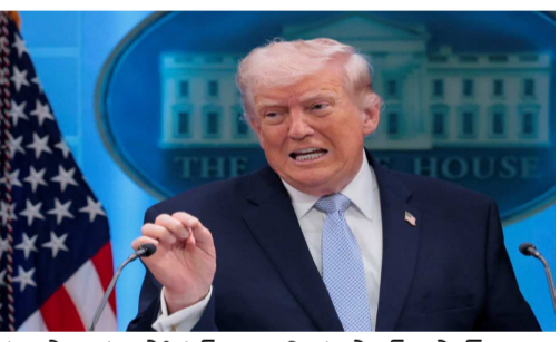
తన సొంత సోషల్ మీడియా ప్లాట్ ఫామ్ ది ట్రూత్ లో ఇరాన్ పై ఆగ్రహం వ్యక్తం చేస్తూ వరుస పోస్టులు పెడుతున్నారు. శుక్రవారం పెట్టిన ఓ పోస్టులో.. 'ఇరాన్ యుద్ధం చేసే దానికంటే.. ఫేక్ న్యూస్ మీడియాను, పబ్లిక్ రిలేషన్స్ ను హ్యాండ్ లో చేయటంతో అద్భుతమైన ప్రతిభ కనబరుస్తోంది'

సీరియస్ వార్నింగ్ ఇచ్చారు. అంతర్జాతీయ జలమార్గాలను బ్లాక్ చేయడం తప్ప.. ఇరాన్ దగ్గర మరో ఆప్షన్ లేదని అన్నారు. హోర్నుజ్ జలసంధిని తెరవాలన్నది తమ డిమాండ్ అని తేల్చి చెప్పారు. చర్చలు విఫలమైతే ఇరాన్ పై మరిన్ని దాడులు చేస్తామని అన్నారు. అత్యుత్తమ ఆయుధాలతో సైన్యం ఇరాన్ పై దాడి చేయడానికి సిద్ధంగా ఉందని తెలిపారు. ఇరాన్ బలగాలు సైనికంగా ఓడిపోయాయని అన్నారు. ఇరాన్ దగ్గర అణ్ణాయుధాలు ఉండకూడదని స్పష్టం చేశారు. ర్చల ఫలితంతో సంబంధం లేకుండా.. హోర్నుజ్ జలసంధి దానంతట అదే తెరుచుకుంటుందని, త్వరలోనే హోర్నుజ్ జలసంధి తెరుచుకునేలా చేస్తామని అన్నారు. కాగా, ఇరాన్ తో చర్చల నేపథ్యంలో ట్రంప్