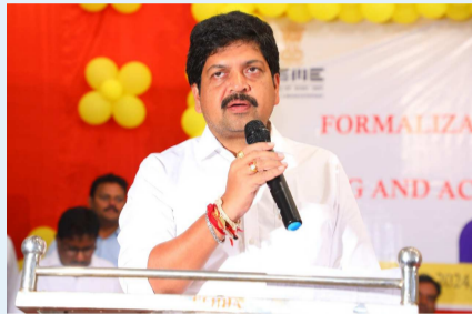
అమరావతి, ఐఎన్ టీవీ టైమ్స్

వైఎస్ జగన్ పై మంత్రి కొల్లు రవీంద్ర తీవ్ర విమర్శలు గుప్పించారు. జగన్ కు తల్లి, చెల్లి, రాష్ట్రం, దేశం పట్ల ఎలాంటి బాధ్యతా భావం, భక్తి లేవని ఆయన ఘాటుగా వ్యాఖ్యానించారు. తీర ప్రాంత భద్రతను బలోపేతం చేయడానికి రానున్న సాగర్ డిఫెన్స్ ప్రాజెక్టును కూడా తరిమేస్తానని జగన్ మాట్లాడుతున్నాడని ఆగ్రహం వ్యక్తం చేశారు. భవిష్యత్తులో శత్రు దేశాల నుంచి వచ్చే ముప్పులను ఎదుర్కొనేందుకు ఈ ప్రాజెక్టు అవసరమని ఆయన పేర్కొన్నారు. తీర ప్రాంతంలో తమిళనాడు మత్స్యకారులు ఆంద్రప్రదేశ్ జలాల్లోకి వచ్చి నమస్కలు సృష్టించడం పెద్ద సమస్యగా మారిందని చెప్పారు.