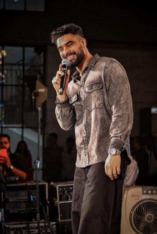
తెలుగులోనూ విడుదల కానుంది.

నాకు ఇష్టం ఉండదు. ఒక సినిమా పూర్తయ్యాకే మరో సినిమా చేస్తుంటా. ఒకవేళ నేను టాలీవుడ్లో ఓ పెద్ద సినిమాలో నటిస్తే.. నేను అంగీకరించిన మూడు/నాలుగు మలయాళ చిత్రాలపై ప్రభావం పడుతుంది. అందుకే తెలుగు సినిమాల్లో నటించలేకపోతున్నా' అని వివరించారు. డిజ్ జోన్ ఆంటోనీ దర్శకత్వం వహించిన 'పల్లీచట్టంబి' ఏప్రిల్ 10న