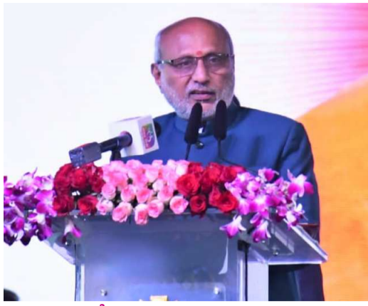
ఏయూ నుంచే జైత్ర యాత్ర ప్రారంభం..

బొబ్బిలి రాజులు ఈ యూనివర్సిటీ అభివృద్ధి కృషి చేశారు. వారిని మనం స్మరించుకోవడం ధర్మం, బాధ్యత. కట్టమంది రామలింగారెడ్డి ఏయూకు మొదటి వీసీగా చేసి బలమైన పునాది వేశారు. ఆయన కూడా చిత్తూరు జిల్లా వాసీ. నేనూ చిత్తూరు జిల్లా నుంచి వచ్చి వందేళ్ల ఉత్సవంలో పాల్గొన్నాను. 2వ వీసీ సర్వేపల్లి రాధాకృష్ణ దేశ రాష్ట్రపతి అయ్యారు. ఈ రోజు మన ఉపరాష్ట్రపతి సీపీ రాధాకృష్ణన్ తండ్రి సర్వేపల్లి రాధాకృష్ణ అభిమాని. ఈయనకు రాధాకృష్ణన్ అని పేరు పెట్టారు. కేవలం చదువు చెప్పడమే కాదు తెలుగు వైభవానికి ఏయూ కృషి చేస్తోంది. విద్య, సాహిత్య, కళా రంగాల్లో ప్రముఖులను కళా ప్రపూర్ణ ఆచార్యులతో గౌరవిస్తున్నారని సీఎం చంద్రబాబు అన్నారు. ఏయూ అభివృద్ధికి రూ.500 కోట్లు ఏయూలో చదువుకునేవారంతా అదృష్టవంతులు. ఇక్కడ చదువుకుంటే ఎంత బావుంటుందో అనే ఆలోచన మళ్లీ నాకూ వస్తోంది. ఉపకులపతికి లక్ష్యం నిర్దేశిస్తున్నాం. ఏయూ దేశంలో యూనివర్సిటీల్లో టాప్-5 జాబితాలో ఉండాలనేది నా ఆకాంక్ష. ప్రపంచంలో 100 అత్యుత్తమ యూనివర్సిటీల్లో ఆంధ్ర యూనివర్సిటీ ఉండాలి. ఏయూ వందేళ్ల చరిత్ర రోజున చెప్పన్నా రాబోయే వందేళ్లలో ఏయూ మరో చరిత్ర సృష్టిస్తుంది. బెస్ట్ బ్రాండ్ క్రియేట్ చేస్తుందని సీఎం చంద్రబాబు అన్నారు.