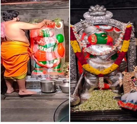
ఆంజనేయస్వామి ఆలయాలు స్వామివారి నామస్మృ రణతో మారుమోగాయి.. పలు గ్రామాలలోని ఆలయా ల్లో 108 సార్లు హనుమాన్ చాలీసా పారాయణం భక్తులు భక్తిశ్రద్ధలతో నిర్వహించారు.. గ్రామాలు జై భజరంగబలి జైశ్రీరామ్ జై హనుమాన్ సంకీర్తనతో మారుమోగాయి.. కమిటీ సభ్యుల పర్యవేక్షణలో వచ్చిన భక్తులకు అన్నప్రసాద వితరణ జరిగింది

అభిషేకాలు విశేష అర్చనలు పూజలు జరిగాయి.. ఆలయాల వద్ద భక్తులు భారులు తీరిస్వామివారిని దర్శించుకుని ప్రత్యేక పూజలు నిర్వహించారు పల్లగిరి గుట్టపై పల్లగిరి గట్టుపై వేంచేసి ఉన్న అభయ వీరాంజనేయ స్వామి వారి దేవాలయంలో హను మజయంతి భక్తిశ్రద్ధలతో ఘనంగా నిర్వహించారు, ఆంజనేయ స్వామి వారికి అత్యంత ప్రీతికరమైన మంగళవారం పర్వదినాన పల్లగిరి గట్టుపై గల అభయ వీరాంజనేయ స్వామి ఆలయం, అడవి రావులపాడు, కే కండ్లగిరి అగ్రహారం దాసాంజనేయ స్వామి, మాగల్లు భక్తాంజనేయ స్వామి, చందాపురం ప్రసన్నాంజనేయ స్వామి ఆలయాల్లో తెల్లవారజాము నుండి భక్తులు భారులు తీరి స్వామివారిని దర్శించుకుని ప్రత్యేక పూజలు నిర్వహించారు, ఆయా ఆలయాల్లో స్వామి వారికి సుప్రభాత సేవ అష్టోత్తర శత కలశ పంచామృత అభిషేకాలు, తమలపాకులు అరటి పళ్ళు మామిడి పళ్ళు పూలతో విశేష అర్చనలు, లక్ష్మ మల్లెల అర్చన, మూలమంత్ర హోమాది క్రతువులు పూర్ణాహుతి పూజలు వేదోక్తంగా జరిగాయి..