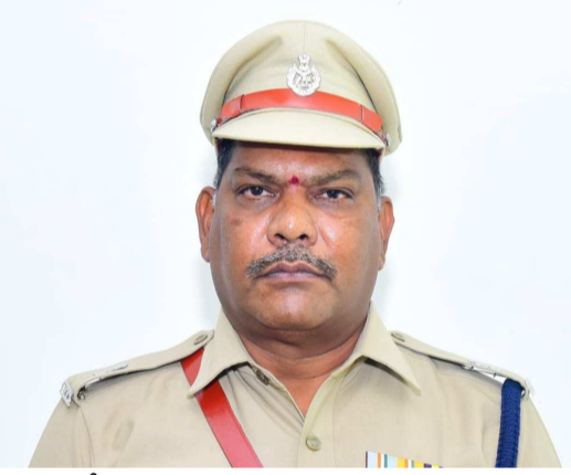
కూడళ్లలో జాయింట్ యాక్షన్ బృందాల ద్వారా పలు చెక్ పోస్ట్ లను ఏర్పాటు చేయడంతో పాటు అన్ని ప్రదేశాలలో తనిఖీలను నిర్వహించడం జరుగుతుంది.

ఫోన్ నెంబర్: 9490493192. దీనివలన నగరంలో జంతువులపై జరుగు హింసను అరికట్టవచ్చు, జంతువులను హింసించిన వారిపై శాశ్వతంగా Pradesb Cow Slaughter Prohibition and Animal Preservation Act-1977, the Transport of Animals Rules-1978, Transport of Animals (Amendment) Rules-2001, and Slaughter House Rules-2001 eTjJáTT Prevention Of Cruelty To Animals శాఖ-1960 శాఖం క్రింద చట్టప్రకారం చర్యలు తీసుకోవడం జరుగుతుంది. బక్రీద్ నేపథ్యంలో జంతువుల అక్రమ రవాణా మరియు వధ మొదలగు నేరాలను నివారించడానికి ఎన్.టి.ఆర్.పోలీస్ కమిషనరేట్ వ్యాప్తంగా ముఖ్యమైన