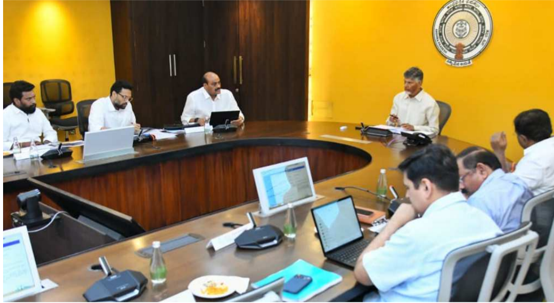
కల్పించాలి. ఫుడ్ ప్రాసెసింగ్ లో రంగంలో రాష్ట్రంలో ఇస్తే రైతులకు ఎంతో మంచి జరుగుతుందని సీఎం ఆపార అవకాశాలు ఉన్నాయి. వాటిని సద్వినియోగం చేసుకుని పెట్టుబడులు గ్రౌండ్ అయ్యేలా చూడాలి. సాయిప్రసాద్, మంత్రులు టీజీ భరత్, మన రాష్ట్రంలో ఉద్యాన, వాణిజ్య పంట ఉత్పత్తులకు అచ్చెన్నాయుడు, సుభాష్, వివిధ శాఖల అధికారులు, విలువ జోడింపు జరగాలి. ఆయిల్ పాం, మామిడి, వర్చువల్గా మంత్రి పయ్యపుల కేశవ్ పాల్గొన్నారు. కొబ్బరి, కోకో సహా పలు పంటలకు వ్యాల్వ్యా ఆడిషన్

స్వస్థించాలని సూచించారు. ప్రస్తుత పోటీ ప్రపంచంలో పెట్టుబడులను ఆకర్షించాలంటే ఇతరుల కంటే మనం ఎలా భిన్నమో ఏపీలో అనుమతులు ఎంత సులభతరమన్నది చాటి చెప్పాలని ఆయన స్పష్టం చేశారు. ఏపీలో ప్రాజెక్టులు రావాలన్న తపన ఉన్న అధికారులను అనుమతులు ఇచ్చే స్థానాల్లో నియమించాలని సూచించారు. వన్ ఫ్యామిలీ- వన్ ఎంట్రప్రెన్యూర్లో ఎంఎన్ఎంకల కీలకం సచివాలయంలో జరిగిన 17వ ఎన్ఐపీబీ సమావేశంలో 25 ప్రాజెక్టులకు చెందిన రూ.2,01,023 కోట్ల పెట్టుబడులకు ఆమోదం తెలిపారు. ఈ ప్రాజెక్టుల ద్వారా 39,067 మందికి ఉద్యోగ అవకాశాలు లభించనున్నాయి. సమావేశంలో ముఖ్యమంత్రి మాట్లాడుతూ పెట్టుబడుల విషయంలో భారీ పరిశ్రమలకు ఎంత ప్రాధాన్యం ఇస్తున్నామో ఎంఎన్ఎంకలకు అంత ప్రాధాన్యం ఇవ్వాలి. వన్ ఫ్యామిలీ, వన్ ఎంట్రప్రెన్యూర్ విషయంలో ఎంఎన్ఎంకలు కీలక పాత్ర పోషిస్తాయి. అన్ని పారిశ్రామిక ప్రాంతాలకు గ్యాస్ పైప్ లైన్ అందుబాటులో ఉండేలా మౌలిక సదుపాయాలు