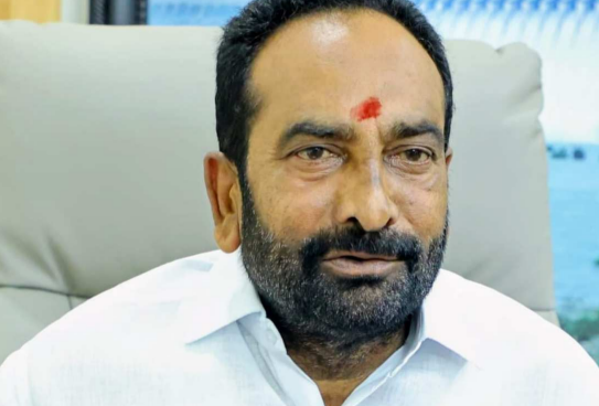
నిర్ణయించుకున్నారని, ఎన్ని కల్లబోలి మాటలు చెప్పినా... పప్పులు ఉడకవని ఎద్దేవా చేశారు