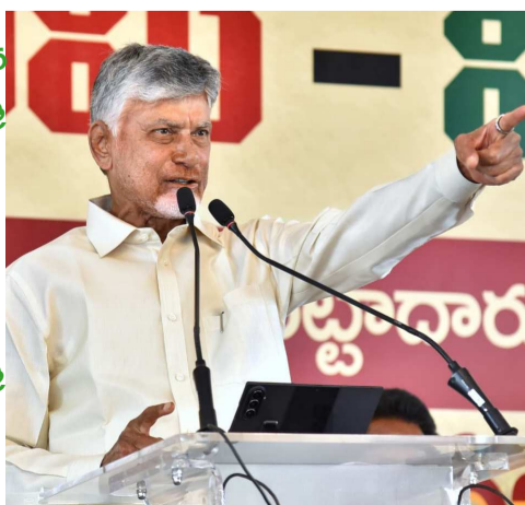
బనగానపల్లె, ఐఎన్ బి టైమ్స్

ప్రజల ఆస్తిపై ప్రజలకే అభికారం ఉండేలా రాజముద్రతో కూడిన పట్టాదారు పాస్ పుస్తకాలను జారీ చేస్తున్నామని ముఖ్యమంత్రి చంద్రబాబు నాయుడు వ్యాఖ్యానించారు. దీర్ఘకాలికంగా పెండింగ్ లో ఉన్న భూ సమస్యలకు పరిష్కారం కల్పించేందుకు ప్రభుత్వం కృషి చేస్తోందని సీఎం స్పష్టం చేశారు. నంద్యాల జిల్లా బనగానపల్లెలో మీ భూమి- మీ హక్కు కార్యక్రమంలో భాగంగా రైతులకు పట్టాదారు పాస్ పుస్తకాలను ముఖ్యమంత్రి పంపిణీ చేశారు.