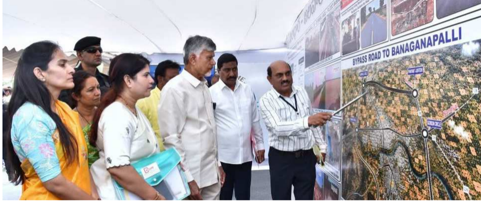
నంద్యాల, ఐఎన్ బి టైమ్స్

గత వైసీపీ పాలకుల నిర్ణయాలతో ప్రజలు తీవ్ర ఇబ్బందులు ఎదుర్కొన్నారని సీఎం చంద్రబాబు అన్నారు. వైసీపీ ప్రభుత్వం తీసుకొచ్చిన ల్యాండ్ టైటిలింగ్ యాక్ట్.. ప్రజల్లో భయాందోళనలు సృష్టించిందని విమర్శించారు. మాట వినని వారి భూములను 22వ జూలైలో చేర్చారని వ్యాఖ్యానించారు. బనగానపల్లెలో రైతులకు పట్టాదారు పాస్ పుస్తకాలను ముఖ్యమంత్రి