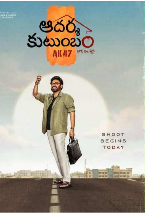
ఆదర్శకుటుంబం సోరీపై చర్చ

విక్టరీ వెంకటేష్ హీరోగా, దర్శకుడు త్రివిక్రమ్ శ్రీనివాస్ తెరకెక్కిస్తున్న ఆదర్శ కుటుంబంపై ప్రేక్షకుల్లో భారీ అంచనాలు నెలకొన్నాయి. ఫ్యామిలీ ఎంటర్టైన్మెంట్ క్రైమ్ థ్రిల్లర్ అంశాలను జోడిస్తూ రూపొందుతున్న ఈ చిత్రం విడుదల తేదీని ఇటీవల చిత్రబృందం అధికారికంగా ప్రకటించింది. గాంధీ జయంతి సందర్భంగా అక్టోబర్ 2న ఈ సినిమాను