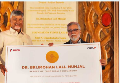
సంబంధించిన కార్యక్రమాలు ప్రారంభం కానున్నాయని తెలిపారు. హీరో సంస్థ మహిళా

పోలీసులకు 63 వాహనాలను అందించడం అభినందనీయమని చంద్రబాబు పేర్కొన్నారు. అలాగే 'పీ4' కార్యక్రమంలో హీరో సంస్థ భాగస్వామ్యం కావడాన్ని స్వాగతించి, పరిశ్రమ ఉన్న ప్రాంతంలో సామాజిక అభివృద్ధి కోసం ప్రత్యేకంగా ఒక సీఈవోను నియమించాలని సూచించారు. మానవ వనరుల అభివృద్ధి రాష్ట్ర ప్రగతికి కీలకమని, లక్షలాది మంది యువతను పారిశ్రామికవేత్తలుగా తీర్చిదిద్దడమే తన లక్ష్యమని ముఖ్యమంత్రి చంద్రబాబు అన్నారు.