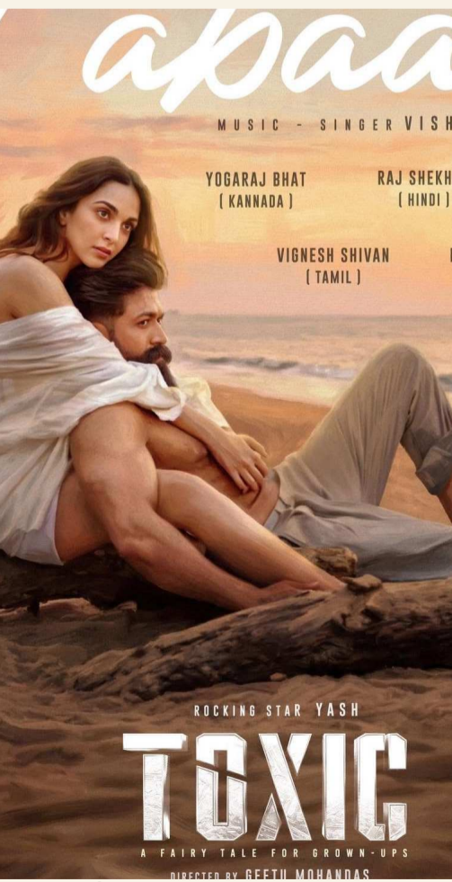
యశ్ హీరోగా గీతూ మోహన్ దాస్ దర్శకత్వంలో రానున్న చిత్రం 'టాక్సిక్' ఆగస్టు